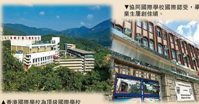
▲香港國際學校為頂級國際學校