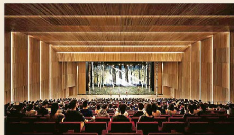
▲深圳南山協同港人子弟學校，提供國際級校園設備。