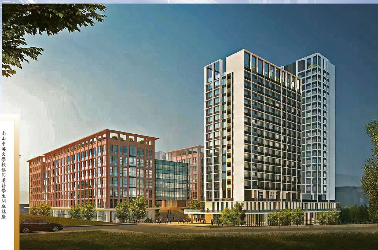
▲香港路德會協同教育集團之深圳南山協同港人子弟學校全貌

2019年發布的《粵港澳大灣區發展規劃綱要》，提出在廣東建設港人子弟學校或設立港澳兒童班並提供寄宿服務，及後教育局倡議由辦學團體到內地設立港人子弟學校，至今已有多達五所學校進駐大灣區。將於今年9月新學年開學的深圳南山協同港人子弟學校，是最新加入的一間，該校辦學團體香港路德會協同教育集團表示，首年提供小一至中三的本地課程，預計提供400至500個學額，明年更開辦高中課程，除了嶄新的硬件配套外，更邀得許多來自各專業領域、國際化的師資團隊加入，為在內地的港人子女提供優質升學機會。