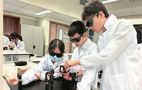
▲學生進行中科院光學實驗