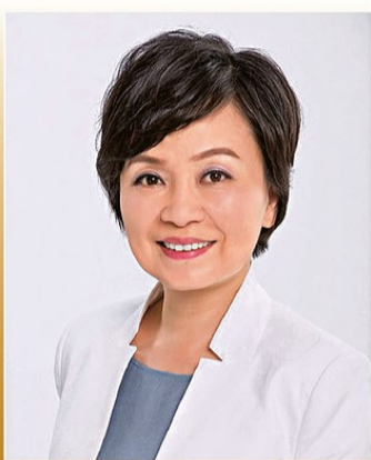
▲教育局局長蔡若蓮為南山協同港籍學生班題字祝賀