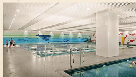
▲學校有恆溫標準游泳池兩個