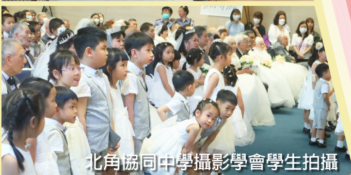
北角協同中學攝影學會學生拍攝