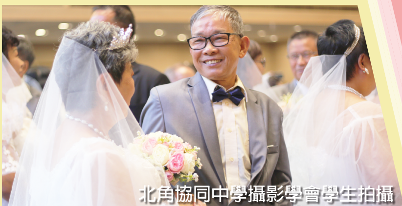
北角協同中學攝影學會學生拍攝

當天，各位同學一早便準時到達淺水灣萬邦堂。首先是要拍攝盛裝打扮的長者在停車場下車的一刻；其後移師去拍攝一眾花仔花女在休息室的快樂時光。很快，重頭戲來了，在時間來到「1314」的一刻，52對長者夫婦莊嚴地踏入萬邦堂，迎接重訂婚盟的時刻。同學們亦抓緊機會，拍下長者們恩愛的舉動，無論是手牽手進入教堂，抑或交換戒指，不同的場景皆被同學紀錄下來，「執子之手，與子偕老」是多麼美麗的一幕，同學們對於能為長者們留下美好的回憶都深感高興。